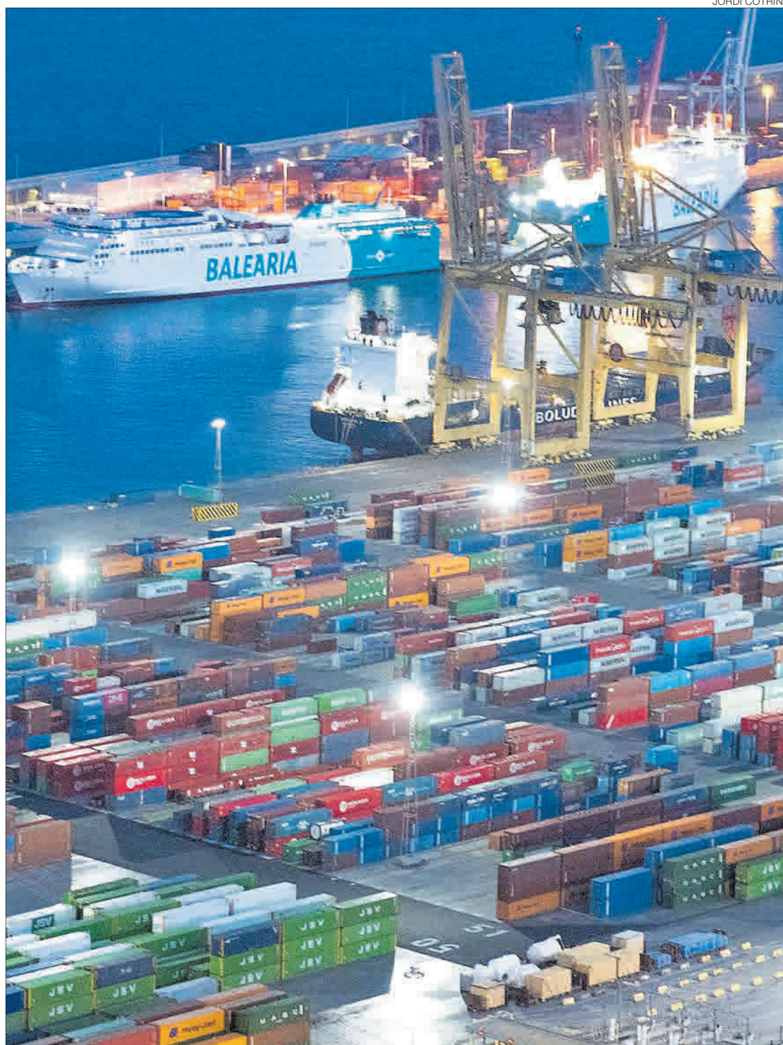
► Vista nocturna del puerto de mercancías de Barcelona.